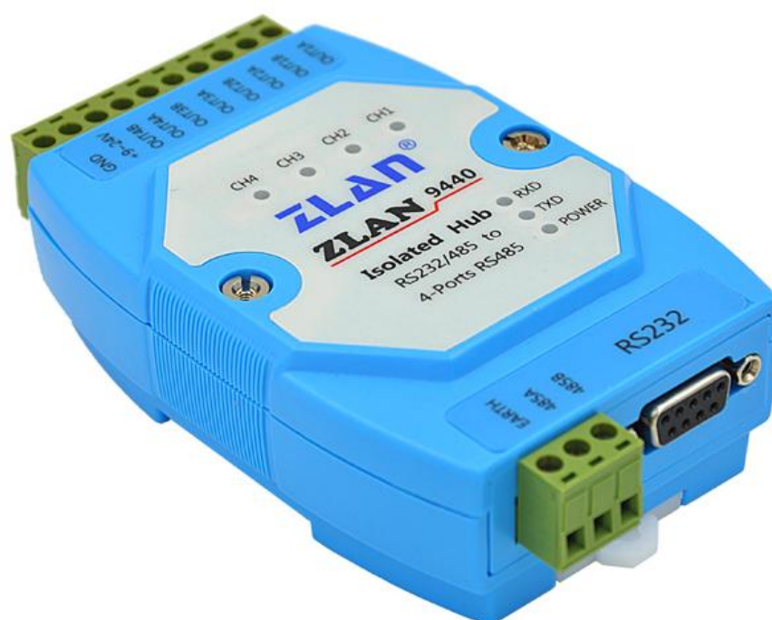
图 1 ZLAN9440 外观

如果只需要一路有源隔离型 RS232 转 RS485 则型号是 ZLAN9410。